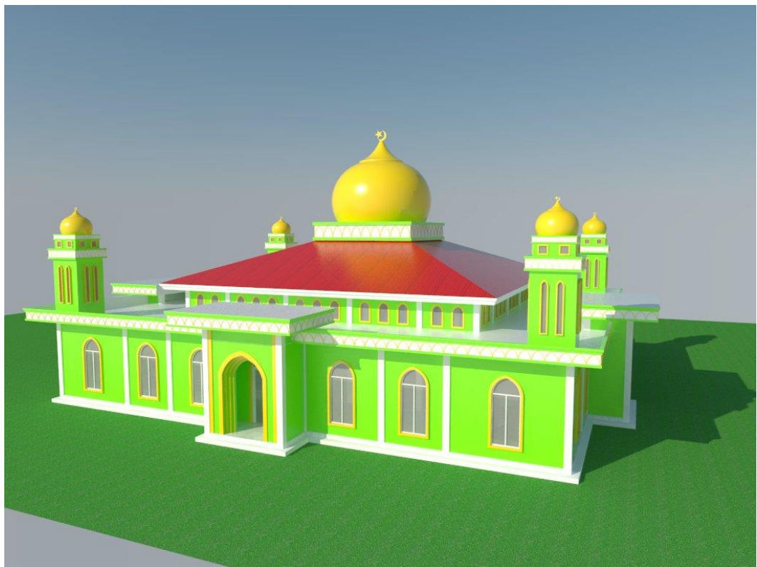
Gambar 5. 1 Tampak Selatan Bangunan

Konsep fasade bangunan dibuat tanpa banyak menggunakan ornamen. Hal ini dikarenakan ornamen tidak berpengaruh signifikan terhadap konsentrasi jamaah dalam beribadah. Sebaliknya yang perlu ditekankan adalah kualitas penghawaan atau sirkulasi udara, pencahayaan di dalam bangunan masjid.