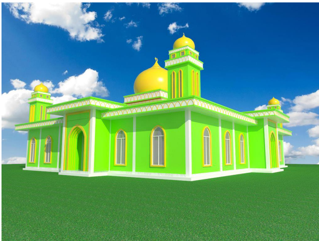
Gambar 5. 2 Tampak Timur Masjid

Skala bangunan memberikan lingkungan yang ramah kepada penggunanya. Gambar 5.2 menunjukkan bahwa masjid dibangun dengan skala “pendekatan” untuk menciptakan rasa kedekatan dengan Sang Khalik ketika beribadah. Selain itu, skala ini dapat memaksimalkan penggunaan energi dan bahan bangunan. Misalnya, lebih sedikit energi yang diperlukan untuk mendinginkan dan