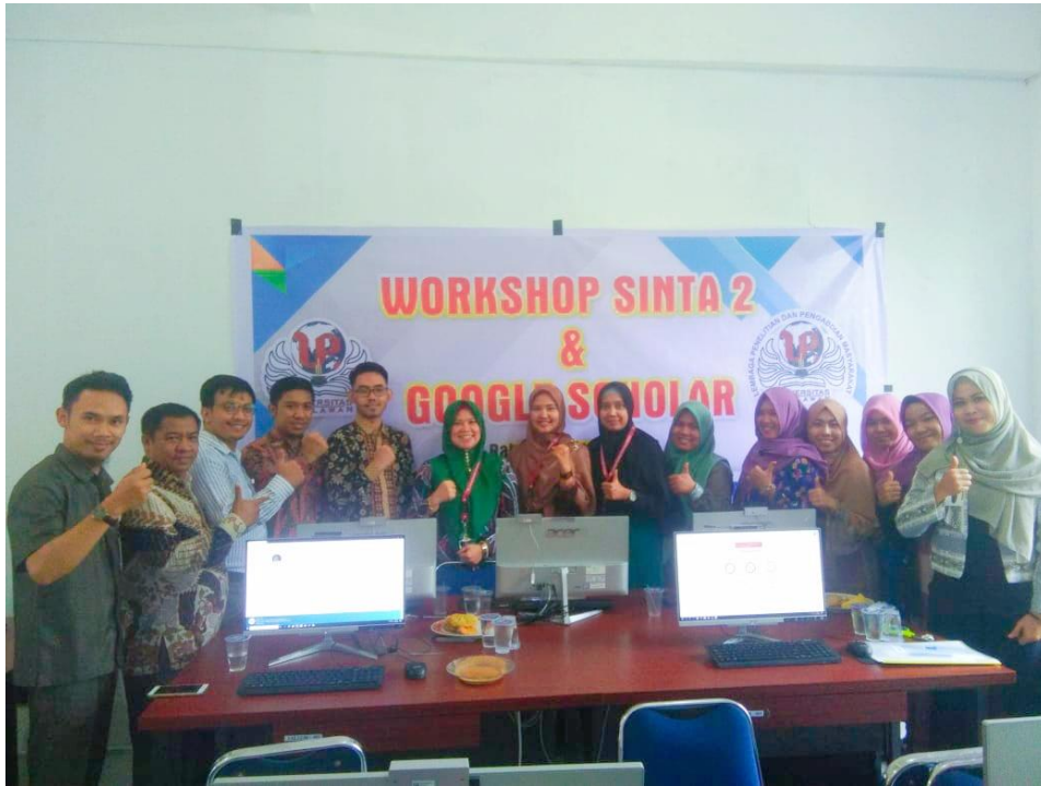
Gambar 5.4 Peserta berfoto Bersama setelah pelatihan