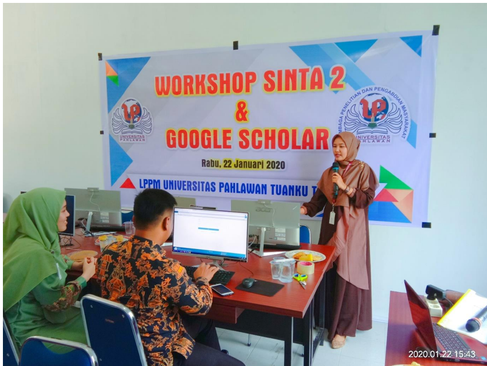
Gambar 5.2 Pemateri menyampaikan materi pelatihan