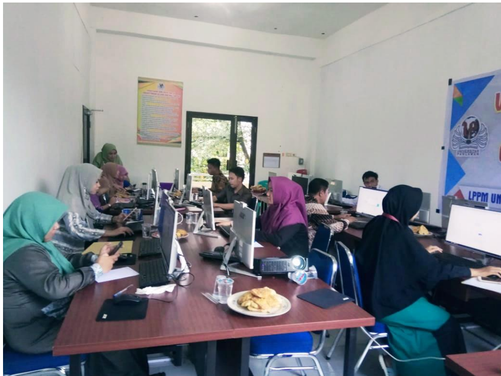
Gambar 5.3 Dosen-Dosen Mendaftar akun GS dan SINTA