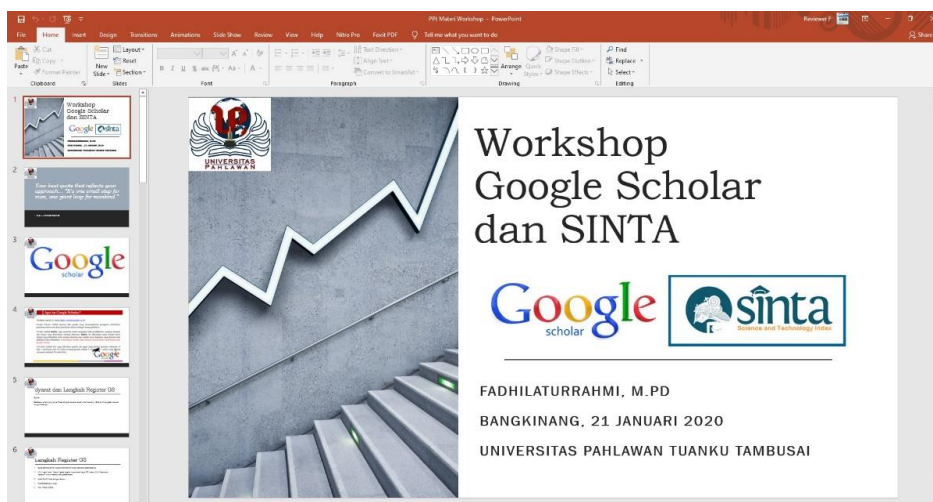
Gambar 5.1 Penyiapan Materi Pelatihan