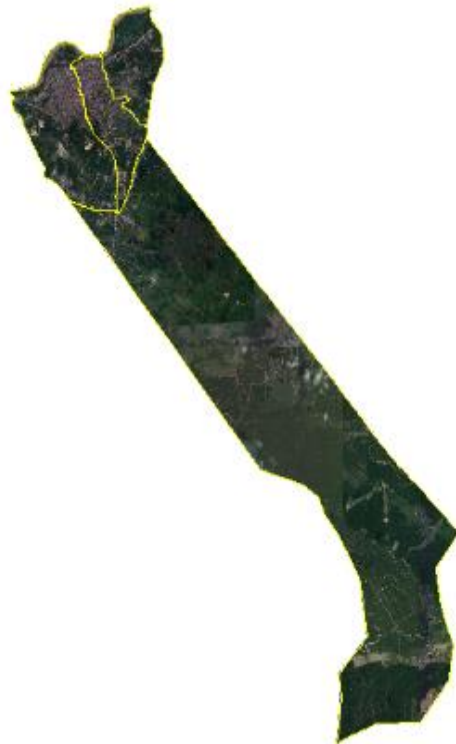
Gambar 6. 1 Citra Satelit Desa Ridan Permai

Peta desa tersebut dibuat dengan menggunakan perangkat lunak SIG yaitu, ArcGIS. ArcGIS digunakan untuk proses pengolahan data mulai dari pemotongan citra, penambahan atribut, dan layout . Penyajian peta desa tersebut sudah disesuaikan dengan Peraturan Kepala Badan Informasi Geospasial Nomor 3 Tahun 2016 Tentang Spesifikasi Teknis Penyajian Peta Desa. Mengetahui informasi potensi apa saja yang ada di suatu desa atau kelurahan dan guna keperluan pembangunann wilayah dengan data yang lebih spesifik yaitu dengan Pembuatan petapotensi desa.