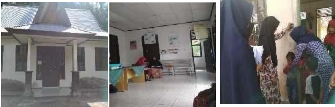
Gambar 1. Posyandu Kasih Ibu Desa Simpang Kubu

Berdasarkan hasil wawancara dengan kader posyandu sayang ibu desa Simpang Kubu yang menjadi permasalahan yaitu rendahnya pengetahuan ibu hamil tentang gizi. Pelayanan posyandu masih banyak dibantu oleh petugas puskesmas. Penyuluhan jarang dilakukan oleh kader karena minimnya alat dan bahan penyuluhan serta kemampuan kader untuk melakukan penyuluhan juga masih rendah.