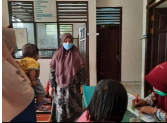
Gambar 1. Pelaksanaan kegiatan PKM di Posyandu Kasih Ibu

Kegiatan penyuluhan ini dilakukan oleh Ketua Tim Pengabdian, di bantu oleh Anggota 1 dan 2. Sebelum kegiatan penyuluhan dilakukan, peserta diberikan kuisisioner untuk mengukur tingkat pengetahuan ibu balita tentang gizi seimbang pada balita. Setelah itu dilakukan kegiatan penyuluhan selama 30 menit. Setelah kegiatan penyuluhan dilakukan peserta diberikan kuisisioner untuk mengetahui perubahan pengetahuan ibu dan pemahaman ibu tentang materi yang diberikan oleh tim pengabdian. Adapun pengetahuan sebelum dan setelah kegiatan penyuluhan gizi dilaksanakan dapat dilihat dari Tabel di bawah ini: