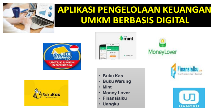
Gambar 2 Aplikasi Pengelolaan Keuangan Berbasis Digitalisasi

Pertama, mengetahui jumlah keuntungan atau kerugian usaha secara tepat. Dengan adanya sistem pembukuan online, pelaku usaha diharuskan untuk tertib dalam melaksanakan seluruh transaksi pada bisnis. Dengan terdapatnya catatan real-time yang berdasarkan standar akuntansi yang baku, hingga pemilik bisnis bisa mengetahui jumlah kerugian ataupun keuntungan yang didapatkan tiap harinya serta tidak butuh lagi mencatat manual. Perihal ini sangat berarti untuk pelaku usaha karena tadinya, untuk mengetahui status laba/ rugi diperlukan penghitungan keuangan secara manual yang pada biasanya sangat melelahkan serta menghabiskan waktu. Dengan dorongan teknologi aplikasi keuangan memakai smartphone, pelaku usaha bisa dengan gampang mengetahui status kesehatan usaha yang dijalani.