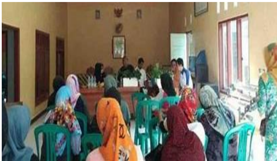
Gambar 5. Kegiatan Pelatihan Pengelolaan Keuangan UMKM

didukung oleh sistem yang bisa dimanfaatkan kapanpun dan dimanapun, pemilik usaha hendak lebih rasional dan mempunyai landasan yang kokoh dalam pengambilan keputusan bisnis. Hanya dengan memandang grafik/ tren pada laporan keuangan, pemilik usaha bisa dengan mudah mengenali aspek- aspek mana yang butuh dipertahankan ataupun diperbaiki lebih lanjut. Melalui informasi pula pelaku UMKM bisa memutuskan kapan waktunya melakukan perluasan pasar( strategi ofensif mencapai konsumen) ataupun efisiensi usaha( strategi defensive mempertahankan keberlangsungan usaha).