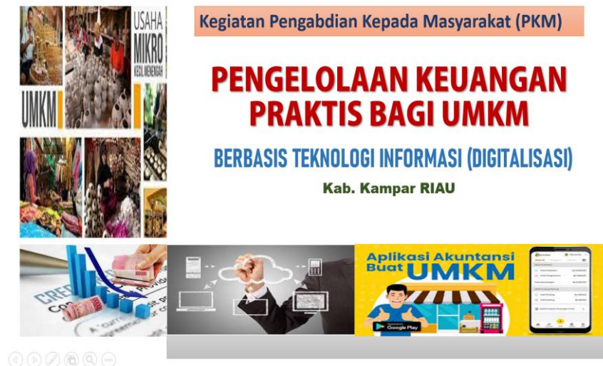
Gambar 1. Pengelolaan Keuangan bagi UMKM

Kegiatan ini memaparkan implementasi pengelolaan keuangan berbasis TI. Penerapan pelatihan berdampak positif terhadap 4 perihal berarti untuk para pelaku usaha yang teratur mengikuti serangkaian jadwal pelatihan dan pendampingan.