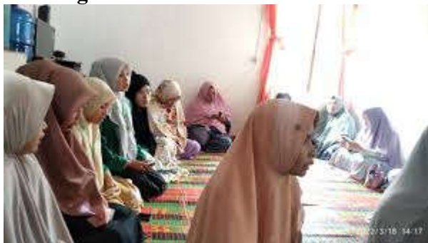
Gambar 1.1 Kegiatan ibu ibu