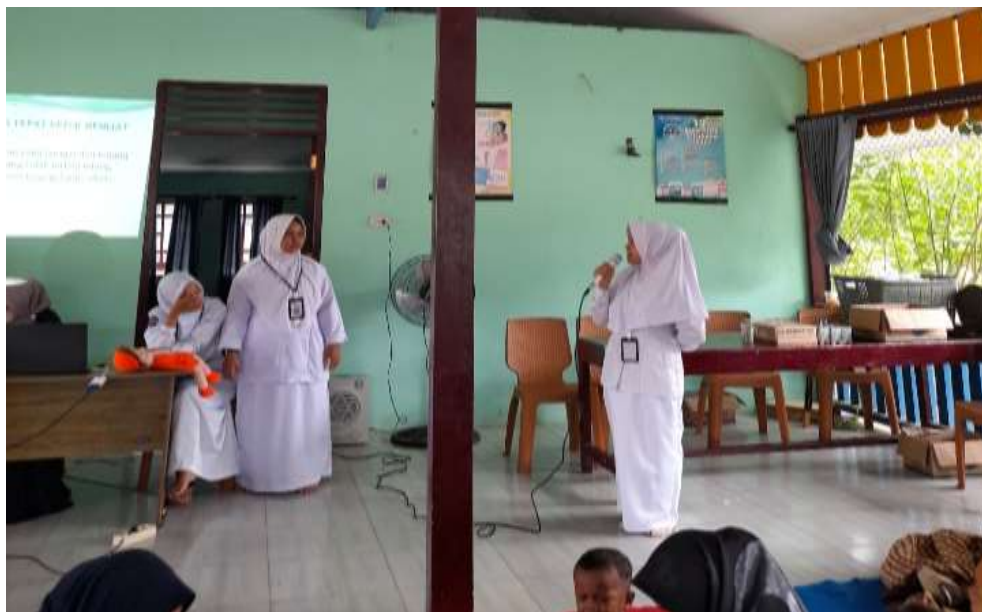
Gambar 1. Promosi Kesehatan Baby Spa di Desa Sei Lambu