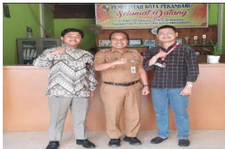
Gambar 1. Kunjungan serta observasi lokasi

Selanjutnya, pelaksanaan kegiatan pengabdian berhasil memunculkan dan meningkatkan kembali motivasi para pelaku usaha agar dapat kembali mengembangkan usaha yang dimiliki, bahkan program pelatihan juga menunjukkan bahwa para pelaku usaha telah mampu mengoperasikan beberapa aplikasi online untuk dapat menjual produk yang dihasilkan.