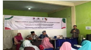
Gambar 2. Presentasi motivasi pentingnya pengusaha UMKM