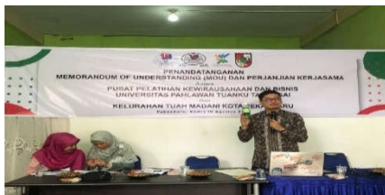
Gambar 3. Presentasi motivasi pentingnya pengusaha UMKM