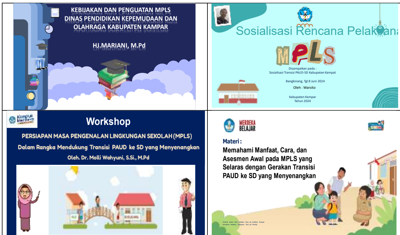
Materi Workshop Best Practice MPLS Transisi PAUD ke SD

Materi yang disampaikan pada saat workshop terdiri dari empat bagian yakni Kebijakan dan Penguatan MPLS Dinas Pendidikan Kepemudaan dan Olahraga Kabupaten Kampar, Sosialisasi Rencana Pelaksanaan MPLS, Persiapan MPLS dalam Rangka Mendukung Transisi PAUD ke SD yang Menyenangkan, Memahami manfaat, cara dan asesmen awal MPLS yang selaras dengan Gerakan Transisi PAUD ke SD yang Menyenangkan.