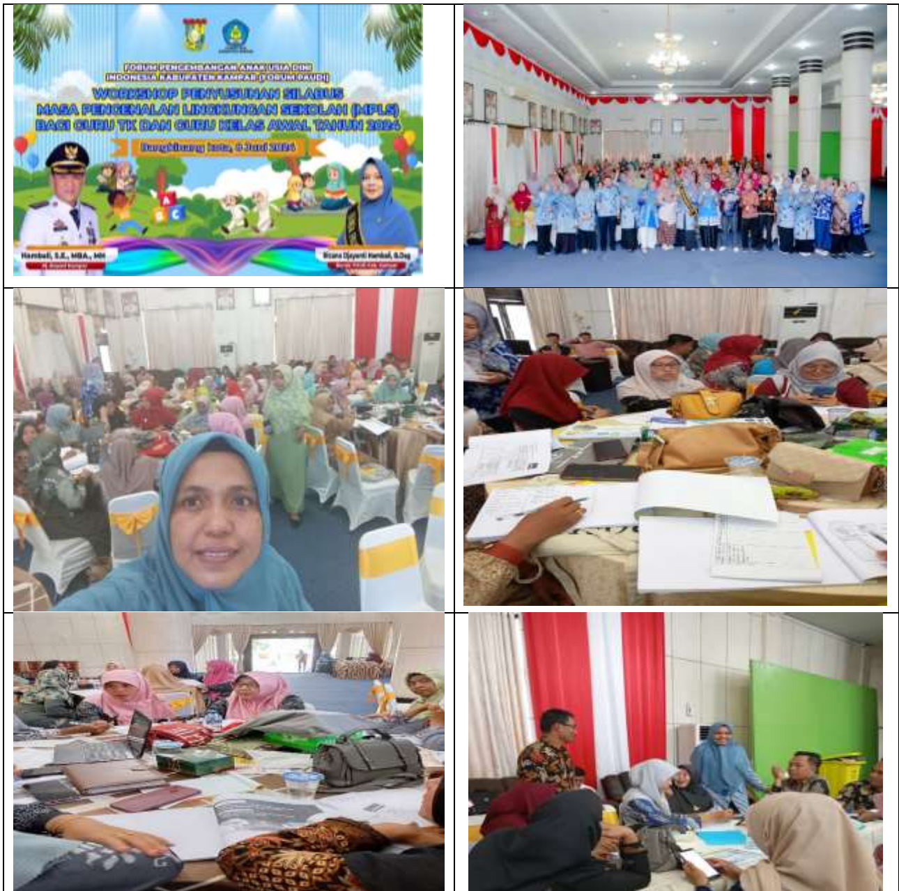
Gambar 2. Dokumentasi Kegiatan Workshop

Pada workshop ini peserta memperoleh kesempatan untuk bertanya pada saat narasumber menyampaikan materi. Setelah materi pengantar disampaikan oleh narasumber, para peserta diberi tugas untuk menyusun silabus dan rincian kegiatan MPLS untuk Transisi PAUD ke SD yang Menyenangkan. Peserta sengaja disusun beragam per kelompok tanpa memperhatikan daerah asal dan tingkatan sekolah asal. Hal tersebut dilakukan agar peserta dapat berkolaborasi antara guru SD awal dengan guru TK, sehingga kolaborasi ini dapat dibangun mulai dari penyusunan kegiatan MPLS hingga nanti diharapkan pada kegiatan praktik pembelajaran.