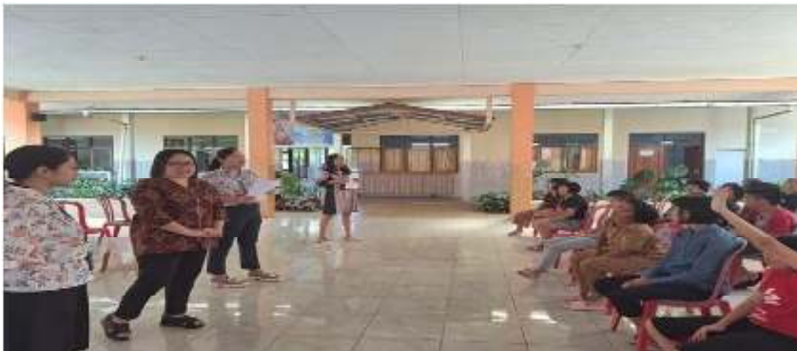
Gambar 2. Pelaksanaan Kegiatan PKM Mengenai Pemanfaatan Jahe Merah ( Zingiber Officinale Roscoe ) Dalam Menurunkan Tekanan Darah Pada Penderita Hipertensi.