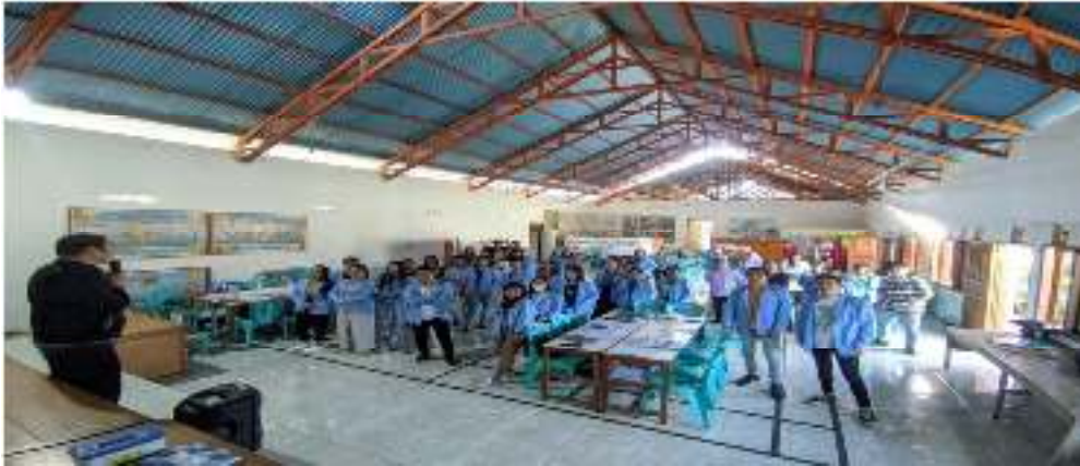
Gambar 1. Kegiatan Pembukaan sekaligus Pemberian Materi