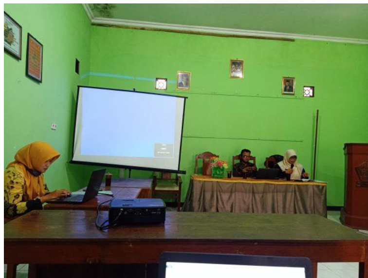
Gambar 3. Penyuluhan Membuat Media Pembelajaran

Pelaksanaan Penyuluhan Pembuatan Media Pembelajaran kepada Guru-Guru PAUD secara umum dapat dikatakan lancar dan sesuai dengan prosedur pengabdian kepada masyarakat yang telah disampaikan pada bagian metode. Prosedur pertama yang dilakukan oleh tim penyuluh adalah memberikan penyuluhan berupa bagaimana membuat media pembelajaran yang layak pakai, ramah lingkungan, aman bagi anak, dan terjangkau biaya pembuatannya. Kegiatan tersebut didokumentasikan pada Gambar 3.