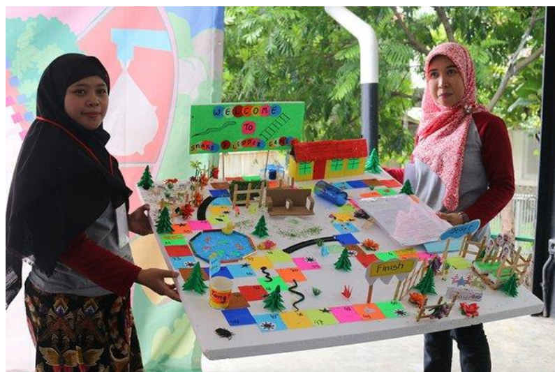
Gambar 5. Media Pembelajaran yang Dibuak Guru PAUD

Tim penyuluh mengamati perubahan perilaku yang diharapkan, yaitu semakin paham dan terampilnya guru dalam membuat media pembelajarannya sendiri. Tim penyuluh mengamati perubahan-perubahan perilaku tersebut dan diharapkan dapat diterapkan pada tindakan nyata yang berpengaruh langsung terhadap kualitas pembelajaran yang guru lakukan baik di dalam kelas maupun di luar kelas. Kebiasaan lama mulai tergantikan dengan kebiasaan baru yang diharapkan lebih baik dalam meningkatkan kualitas pembelajaran yang secara tidak langsung juga akan meningkatkan hasil belajar anak pada semua aspek. Perlu upaya yang konsisten karena membuat media pembelajaran sendiri memerlukan waktu dan keuletan yang maksimal. Selain waktu dan keuletan guru yang maksimal, juga dibutuhkan pengetahuan akan bahan-bahan dan alat-alat yang akan digunakan harus layak pakai, ramah lingkungan, aman bagi anak, dan yang penting adalah terjangkau biaya pembuatannya. Hal tersebut sejalan dengan apa yang dinyatakan Zusrony & Widyaningsih (2021) dan Rangkuti, D., E. & Rangkuti (2020) bahwa membuat media pembelajaran edukatif memerlukan waktu dan dedikasi guru yang sangat baik, sehingga bisa dihasilkan media pembelajaran yang sesuai dan ramah anak.