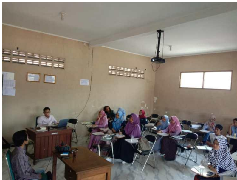
Gambar 4. Diskusi Guru saat Membuat Media Pembelajaran

Tahap kedua yang dilakukan oleh tim penyuluh adalah memberikan kesempatan untuk bertanya, berdiskusi, dan bermusyawarah mengenai kendala-kendala yang dihadapi guru-guru PAUD saat membuat media pembelajaran. Hal-hal yang menjadi kendala yang dirasakan, terutama berkaitan dengan bahan-bahan dan alat-alat saat membuat media pembelajaran. Kegiatan tersebut didokumentasikan pada Gambar 4.