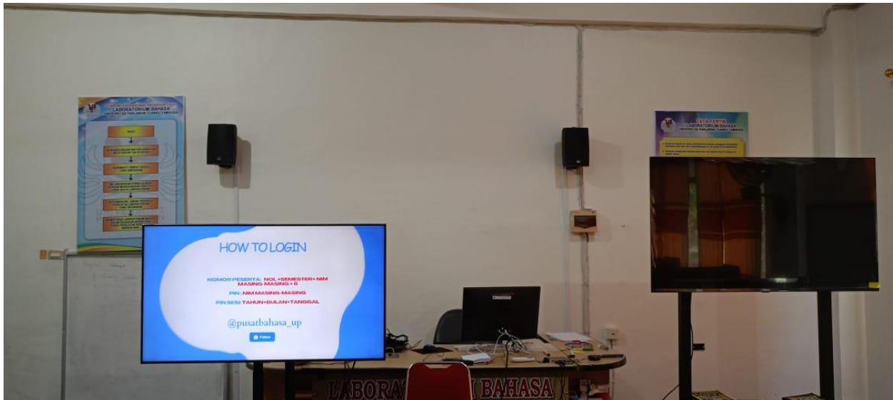
Gambar 6. TV layer LED digunakan sebagai pengganti Proyektor di Laboratorium Bahasa Universitas Pahlawan Tuanku Tambusai