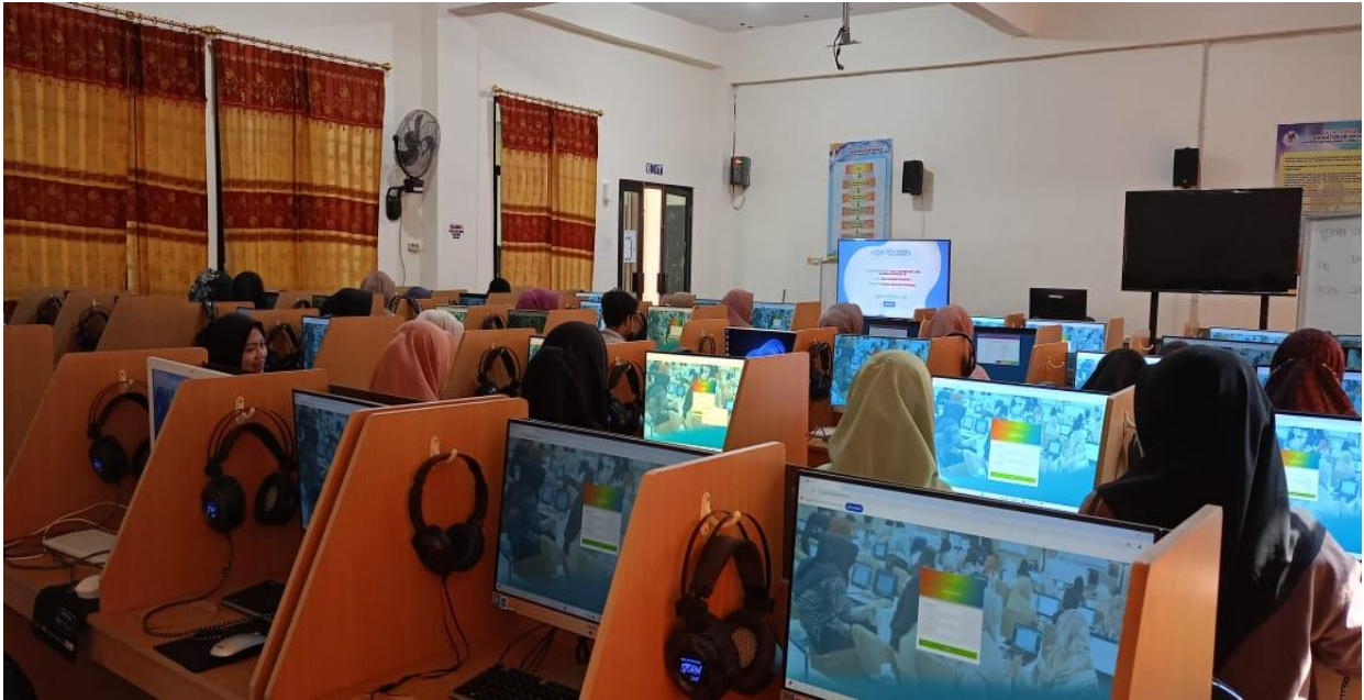
Gambar 2. Peralatan Komputer Mahasiswa di Laboratorium Bahasa yang ada di Universitas Pahlawan Tuanku Tambusai

Laboratorium bahasa ini memiliki fasilitas yang lengkap, baik perangkat keras maupun perangkat lunak. Terdapat 40 komputer mahasiswa dan 1 komputer dosen. Setiap computer dilengkapi aplikasi pembelajaran bahasa, seperti TOEFL, CAT, duolingo, Kahoot, dan quizzes. Beberapa aplikasi tersebut, butuh diperbaharui agar dapat menggunakan aplikasi yang up to date .