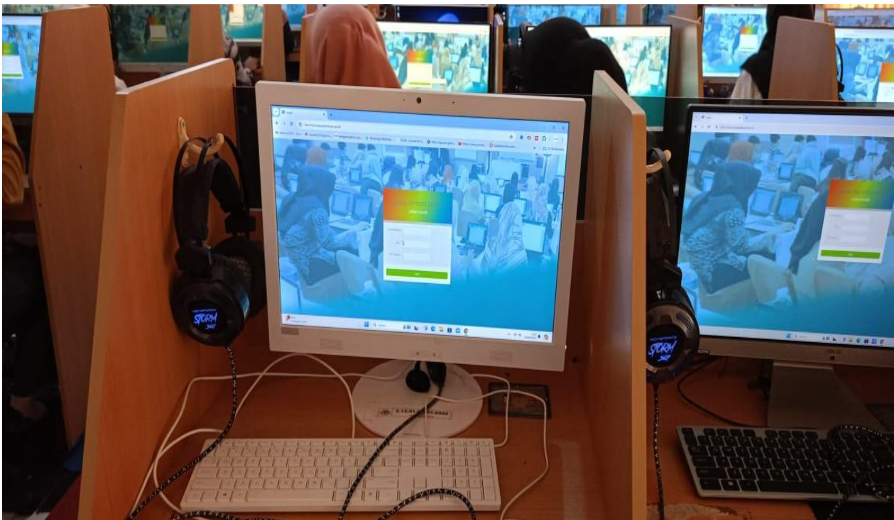
Gambar 1. Aplikasi yang digunakan di laboratorium bahasa

Mahasiswa dapat menggunakan aplikasi dan program yang dirancang khusus untuk meningkatkan keterampilan bahasa.