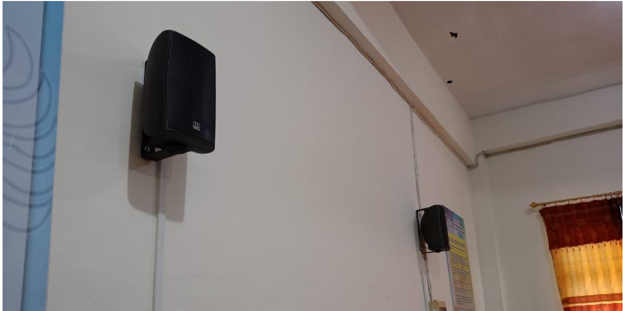
Gambar 4. Speaker yang digunakan di laboratorium Bahasa Universitas Pahlawan Tuanku Tambusai

Perangkat audio yang ada di laboratorium bahasa Universitas Pahlawan Tuanku Tambusai terdiri dari headphone, speaker, mikrofon, TV LED.