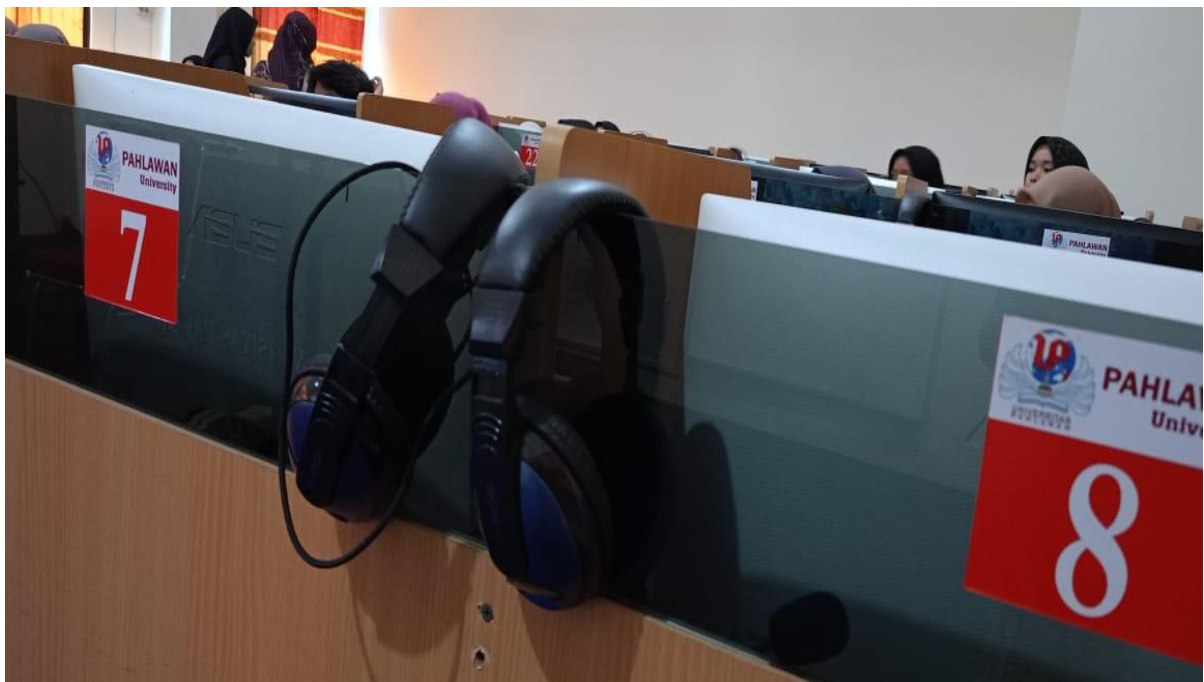
Gambar 5. Headphone yang digunakan di laboratorium bahasa Universitas Pahlawan Tuanku Tambusai

Laboratorium ini dilengkapi dengan headphone, mikrofon, speaker aktif, dan proyektor untuk latihan mendengarkan dan berbicara.