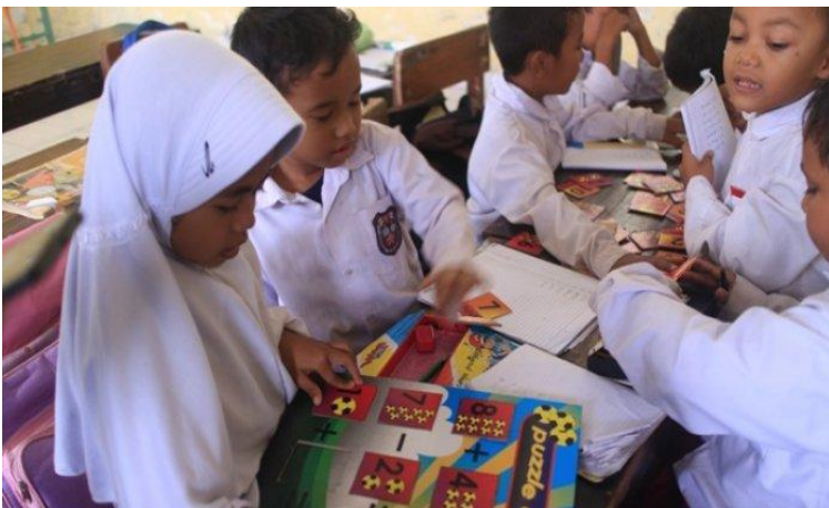
Gambar 6. Kegiatan Explore

Pembelajaran learning cycle (siklus belajar) adalah rangkaian tahapan kegiatan (fase) yang diorganisasikan sedemikian rupa sehingga siswa dapat menguasai kompetensi yang diharapkan dalam pembelajaran aktif. Learning cycle ini juga merupakan sebuah cara inkuiri pada pembelajaran sains yang terdiri dari beberapa tahapan yang berurutan (Marek, 2008).