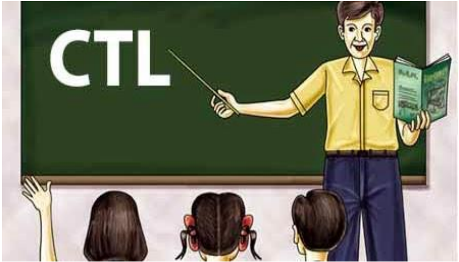
Gambar 2. Pembelajaran CTL

tumbuh dan berkembang, mencapai standar yang tinggi, dan menggunakan penilaian autentik.