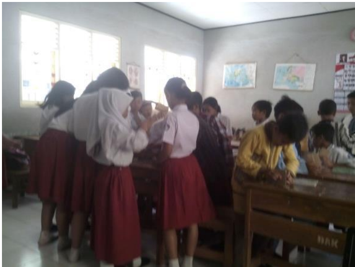
Gambar 3. Kegiatan Masyarakat Belajar

Melalui penerapan pembelajaran secara kelompok yang anggotanya bersifat heterogen, membantu siswa untuk saling membelajarkan, bertukar informasi dan bertukar pengalaman. Kerjasama saling memberi dan menerima sangat dibutuhkan untuk memecahkan suatu permasalahan.