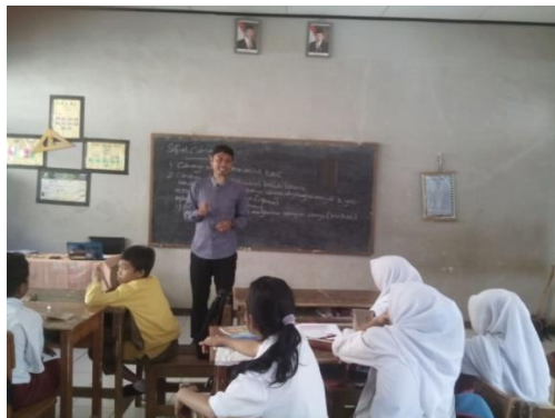
Gambar 5. Kegiatan Design a Plan for the Project

Perencanaan dilaksanakan antara pendidik dan siswa secara kolaboratif. Dengan begitu, diharapkan siswa akan merasa dilibatkan atau “memiliki” proyek tersebut. Perencanaan berisi mengenai aturan main dan pemilihan aktivitas yang dapat mendukung dalam menjawab pertanyaan esensial dengan cara mengintegrasikan berbagai disiplin ilmu yang mungkin, serta mengetahui alat dan bahan yang diperlukan untuk membantu penyelesaian proyek.