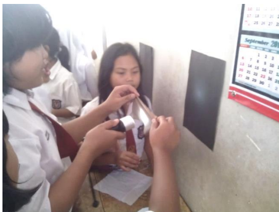
Gambar 4. Kegiatan Mengumpulkan Data

Siswa mengumpulkan data dan informasi sebanyak mungkin untuk menguji hipotesis yang telah mereka kumpulkan. Mengumpulkan data ini bertujuan untuk mengembangkan kemampuan intelektual dan melatih siswa untuk menggunakan seluruh potensi berpikir yang dimilikinya.