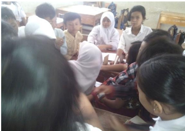
Gambar 9. Kegiatan Explore

Pada fase ini siswa mendapat pengetahuan dengan pengalaman langsung yang berhubungan dengan konsep yang dipelajari. Fase ini ditandai dengan adanya aktivitas siswa untuk mengamati, merekam data, merencanakan dan merancang percobaan, membuat grafik, menafsirkan hasil serta mengolah hasil temuan dalam kelompok kecil tanpa ceramah langsung dari guru. Peran guru dalam fase ini adalah memberi masukan dan meluruskan pemahaman siswa yang masih kurang sesuai.