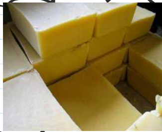
Lilin / Malam