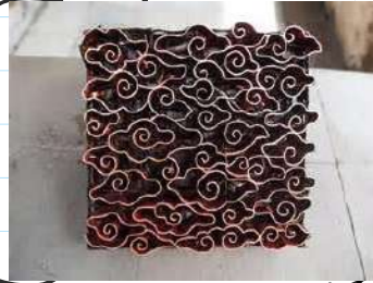
Alat Cap (cetakan)