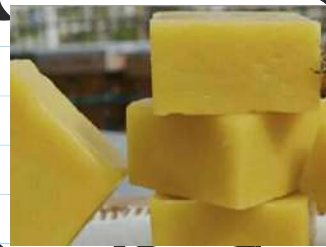
Lilin / Malam