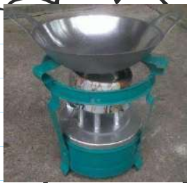
Wajan & kompor