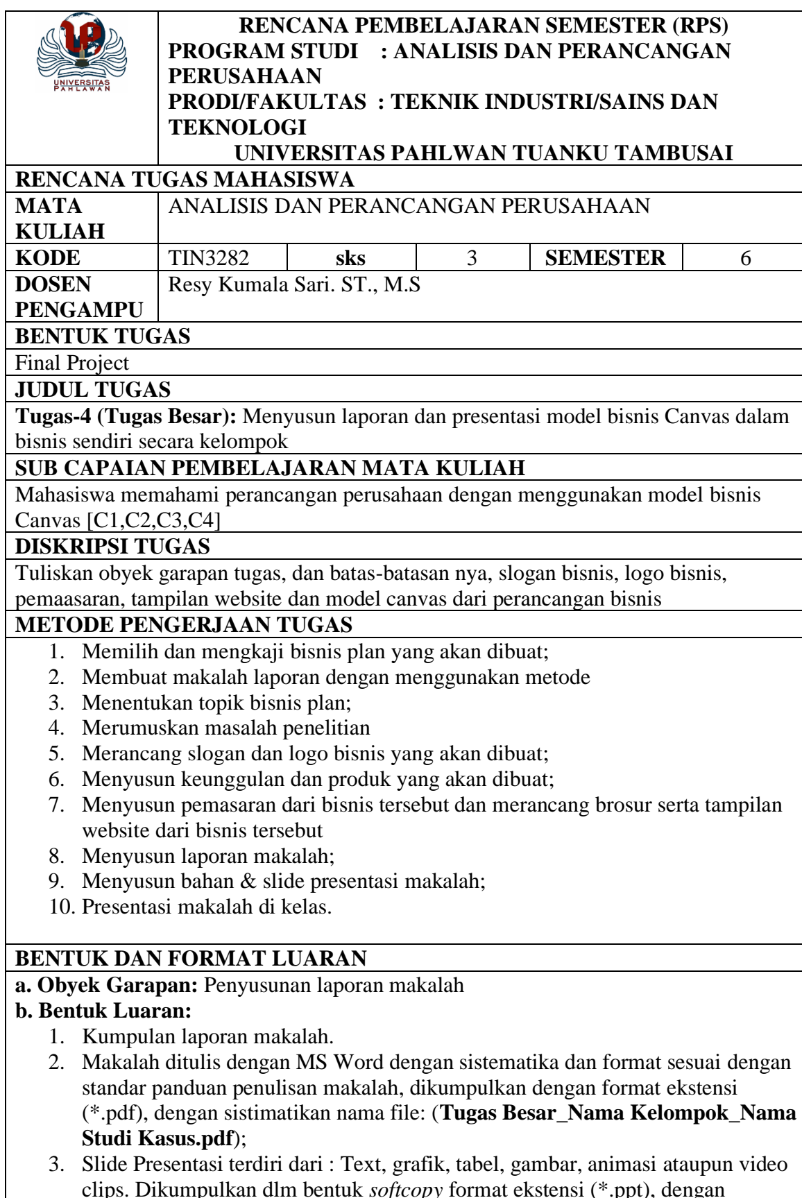
Tabel 4. Contoh Rancangan Tugas Mahasiswa