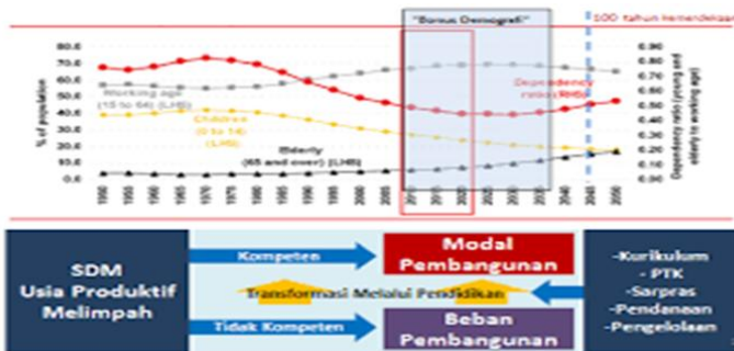
Gambar 1.1 Bonus demografi sebagai modal Indonesia Dikutip dari (Direktorat Jenderal Pembelajaran dan Kemahasiswaan, 2016)

Berdasarkan pada tabel di bawah ini Indonesia pada tahun 2030 – 2045 akan mempunyai usia produktif (15-64 tahun) yang berlimpah. Inilah yang dimaksud bonus demografi. Bonus demografi ini adalah peluang yang harus ditangkap dan bangsa Indonesia harus mempersiapkan dengan baik dan benar, tentunya cara yang paling strategis adalah melalui pendidikan, termasuk pendidikan kewarganegaraan bagaimana kondisi warga negara pada tahun 2045? Apa tuntutan, kebutuhan dan tantangan yang dihadapi oleh negara dan bangsa Indonesia? Benarkah hak ini akan terkait dengan masalah kewarganegaraan dan berdampak pada kewajiban dan hak warga negara.