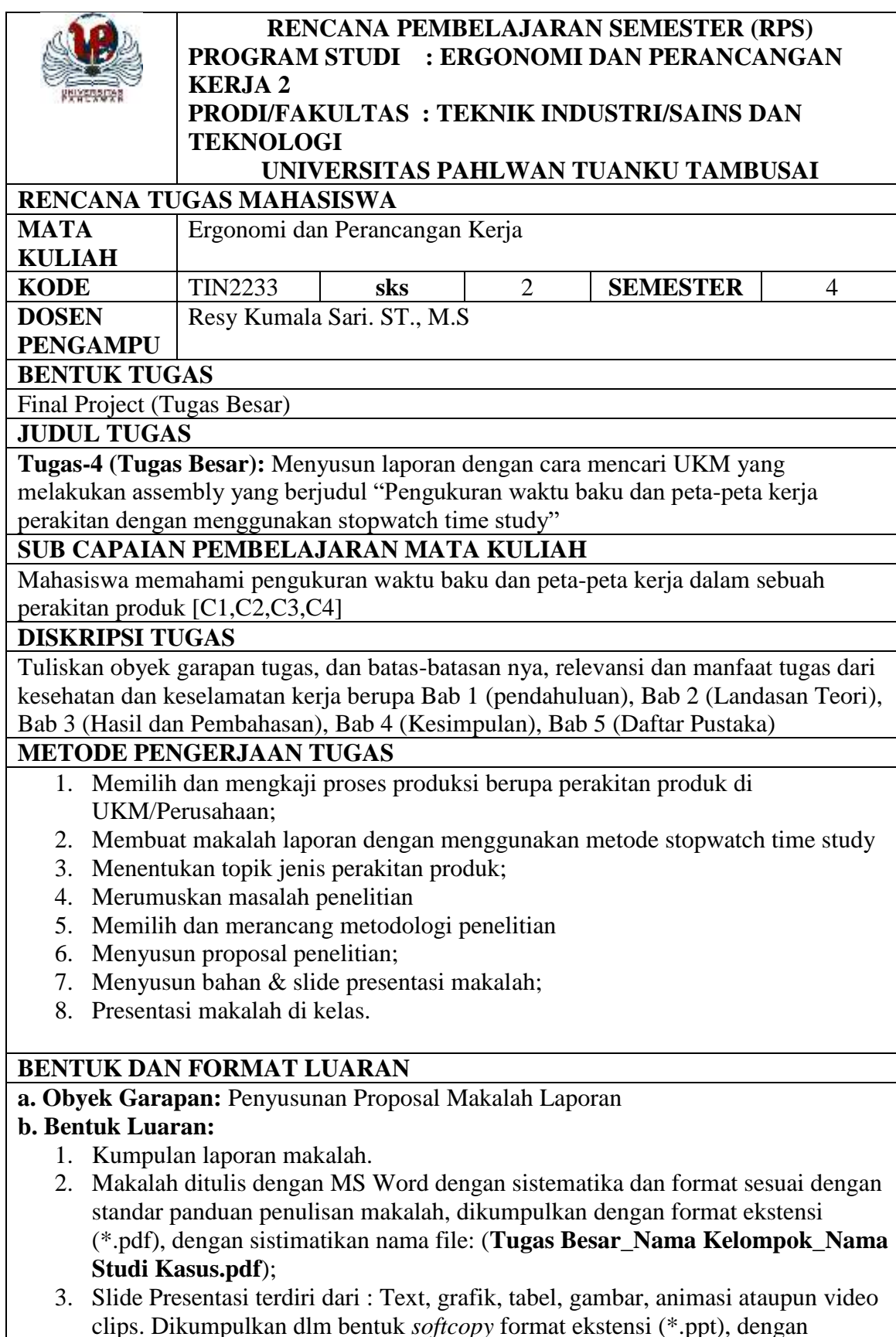
Tabel 4. Contoh Rancangan Tugas Mahasiswa