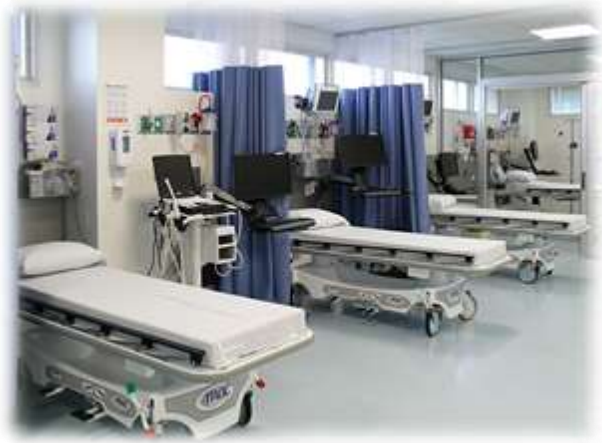
Post Anaesthesia Care Unit (PACU)