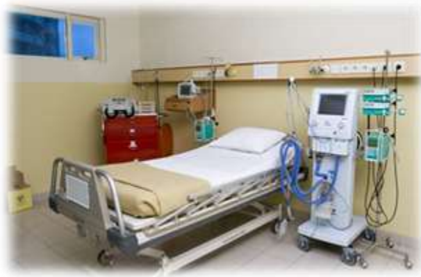
Intensive Care Unit (ICU)