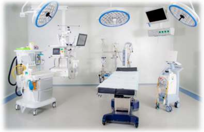
Coronary Care Unit (CCU)